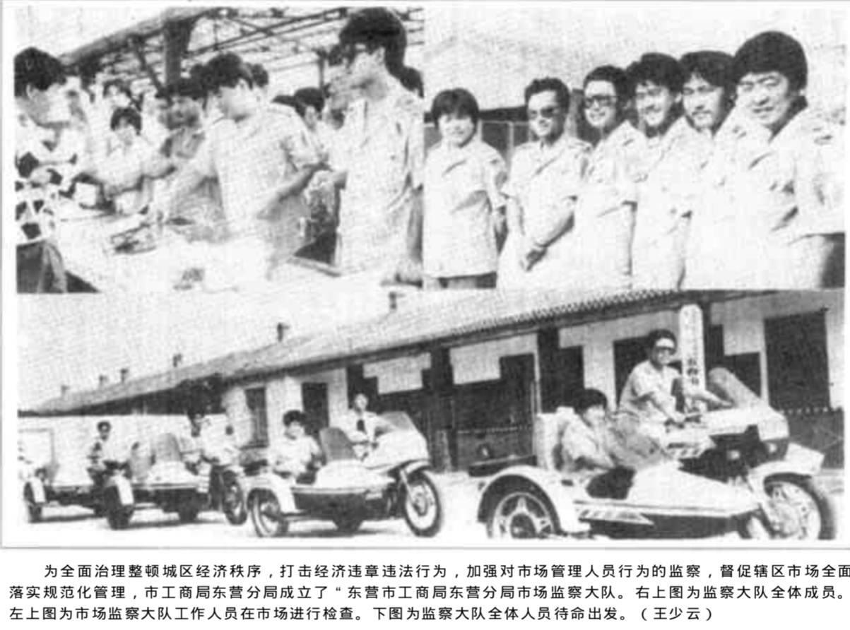
为全面治理整顿城区经济秩序，打击经济违法违纪行为，加强对市场管理人员行为的监督，督促辖区市场全面落实规范化管理，市工商局东营分局成立了“东营市工商局东营分局市场监察大队”。右上图是监察大队全体成员。左上图是市场监察大队工作人员在市场进行检查。下图为监察大队全体人员待命出发。（王少云）